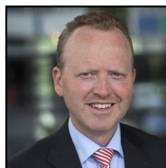
Roald Lapperre Ministerie IenW